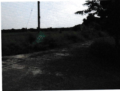
กม.0+000 (จุดเริ่มต้นโครงการ)