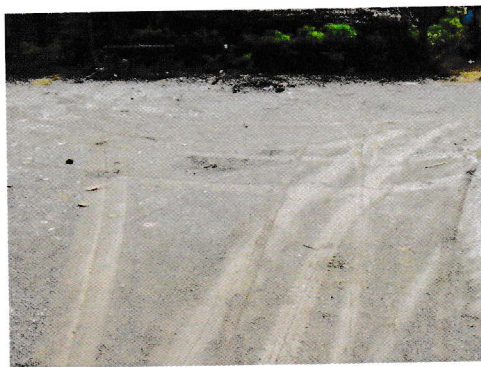
กม.0+207 (จุดสิ้นสุดโครงการ)