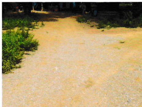
กม.1+439 (จุดสิ้นสุดโครงการ)