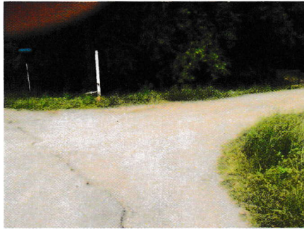
กม.0+000 (จุดเริ่มต้นโครงการ)