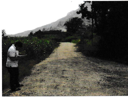
กม.0+000 (จุดเริ่มต้นโครงการ)