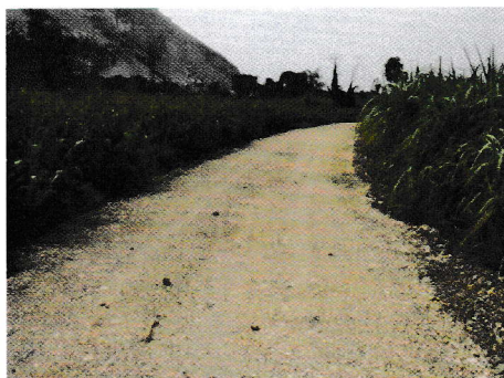
กม.0+530 (จุดสิ้นสุดโครงการ)